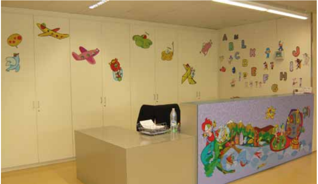
Control Sala Espera