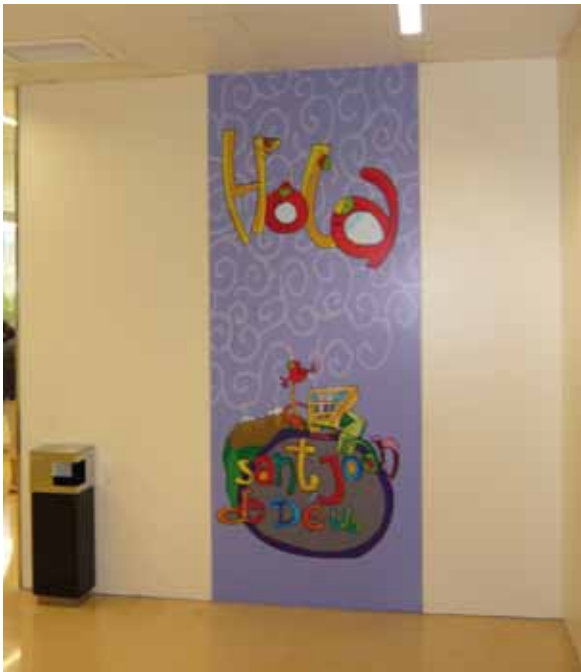
Acceso Sala Espera