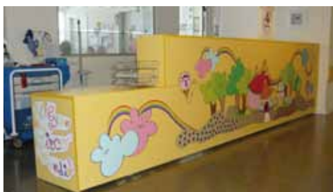
Control de Enfermería

A raíz de este acuerdo se realizó la Humanización de las Zonas de Hospitalización y de la Unidad de Urgencias Pediátricas de este Hospital.