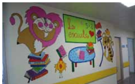
Pasillo acceso a la escuela